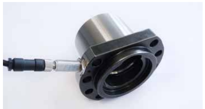
Sensor zur Temperaturermittlung am Mutterflansch

Eine Langzeitüberwachung erkennt Temperaturtrends, die frühzeitig situations- und zeitabhängige Veränderungen anzeigen und zuordnen, ein wichtiger Lebensdauerindikator für Kugelgewindtriebe.